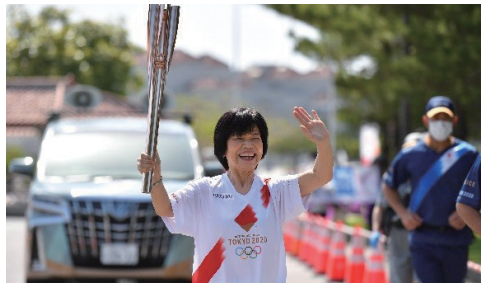
東京オリンピック2020 聖火リレーに希望を乗せて P80