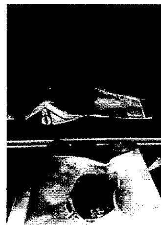
図 2：ロード用の N95 マスクの包装と棚への積載例