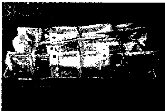
図 1：ロード用の N95 マスクの包装とトレイへの積載例