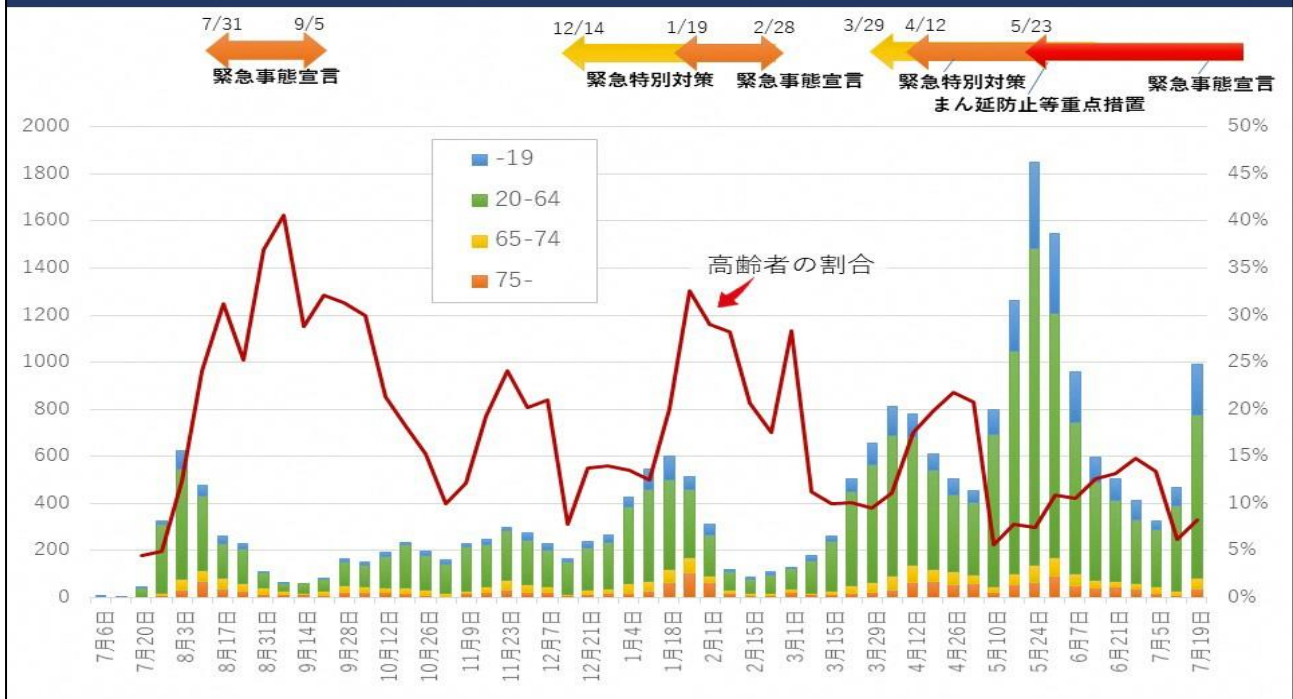
図4 年齢別陽性者数の推移 (週あたり)

65歳以上の高齢者は82人(8%)であり、前週の26人より大きく増加しています(図4)。ただし、このうち40人は単一の医療機関における集団感染です(ほとんどの入院患者がワクチン未接種)。この他、施設内感染5人、家庭内感染15人でした。