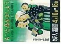
第1回婦人週間ポスター (1949年)

この度、上記行政資料及び展示貸出し資料を譲渡することとなりました。譲渡のお申し込みはHPから可能です。あわせて譲渡会の開催も予定しています。譲渡の詳細や譲渡会の日時等については、別途女性就業支援バックアップナビ（ https://joseishugyo.mhlw.go.jp/ ）にてお知らせいたします。