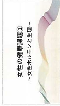
女性の健康課題① ～女性ホルモンと生理～