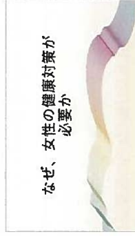
なぜ、女性の健康対策が必要か