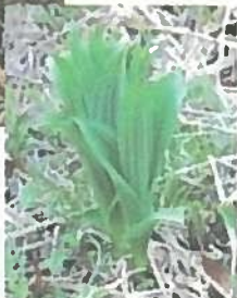
芽出し期のコバイケイソウ