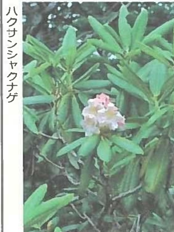
ハクサンシャクナゲ