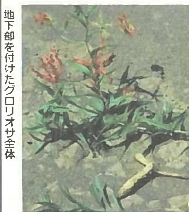
地下部を付けたグロリオサ全体