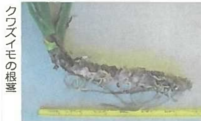
クワズイモの根茎