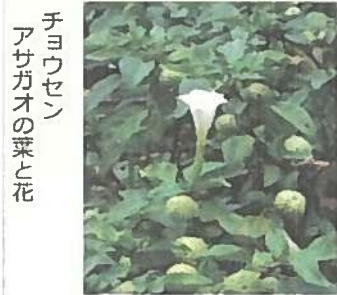
チョウセンアサガオの葉と花