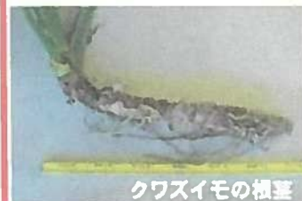
クワズイモの根茎