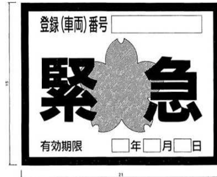
別記様式第7(第6条の2関係)