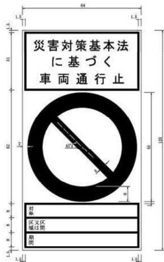
別記様式第2 (第5条関係)