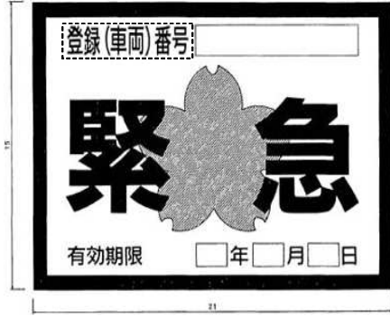
別記様式第4(第6条の2関係)