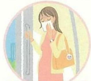
通勤中のつわりが辛い