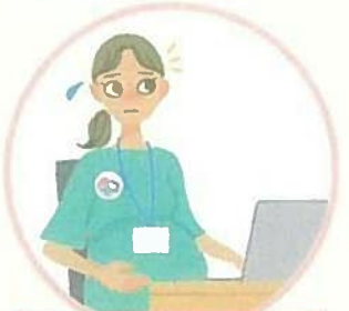
お腹が張ったり痛んだりする