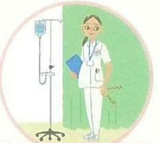
足がむくみ、立ち作業が続けられない