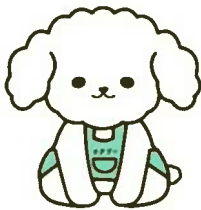
公式マスコットキャラクター「ケアプーン」