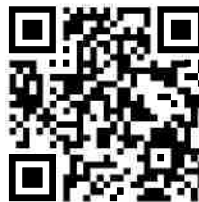
二次元バーコード (参加申込フォーム)

URL: https://biz.nikkan.co.jp/form/ntt_forum/