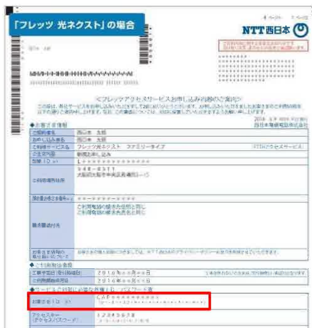
「お申し込み内容のご案内」のイメージ

※参考URL： https://fleets-w.com/user/about_id/