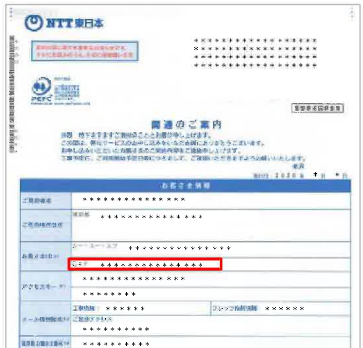
「開通のご案内」のイメージ