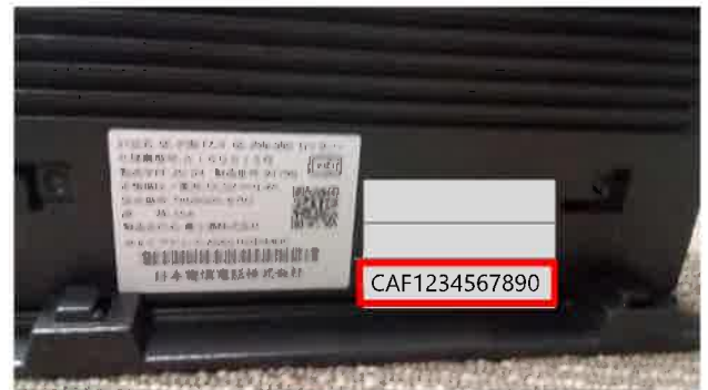
お客さまIDが記載されています。