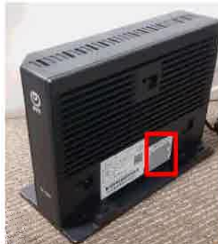
側面に貼付されている シール