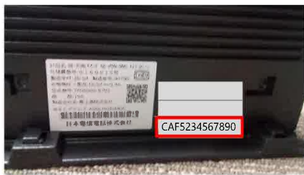
お客さまIDが記載されています。