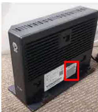
側面に貼付されている シール