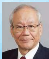
横倉義武共同代表