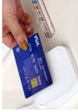
③ キャッシュレス決済環境の整備