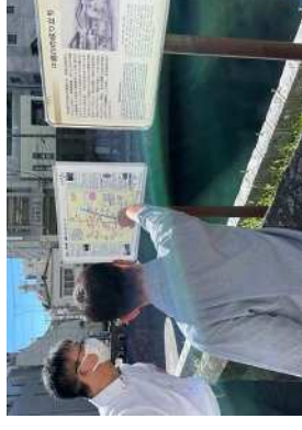
④ 専門家による現地調査