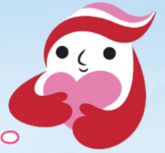
犯罪被害者等支援シンボルマーク 「ギョットちゃん」