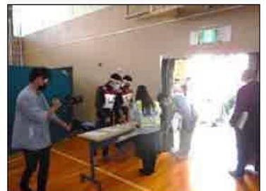
開設訓練の様子