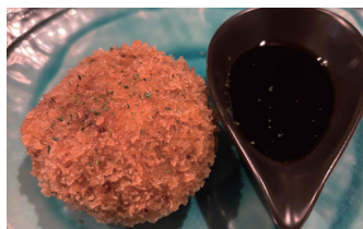
メンチカツテイクアウト専門店 「メンチ屋 石松」 P78