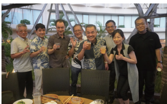
那覇市医師会ビアパーティー IN ロワジールホテル那覇 2025 P33