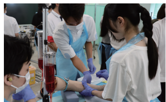
那覇看護専門学校 オープンキャンパス P82